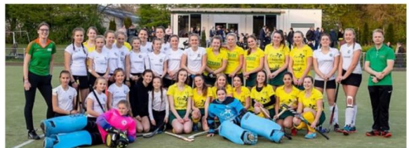
Dinsdagavond 16 april j.l. speelden de HCSO teams meiden A en B tegen de Duitse hockeyclub uit Berlin die in Stadskanaal een trainingskamp houdt. Het was prachtig weer ! Onder toezicht van een groot publiek hebben beide teams een leuke ervaring opgedaan.